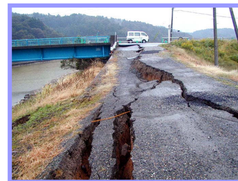
地団研専報54号 「新潟県中越地震の被害と地盤」より