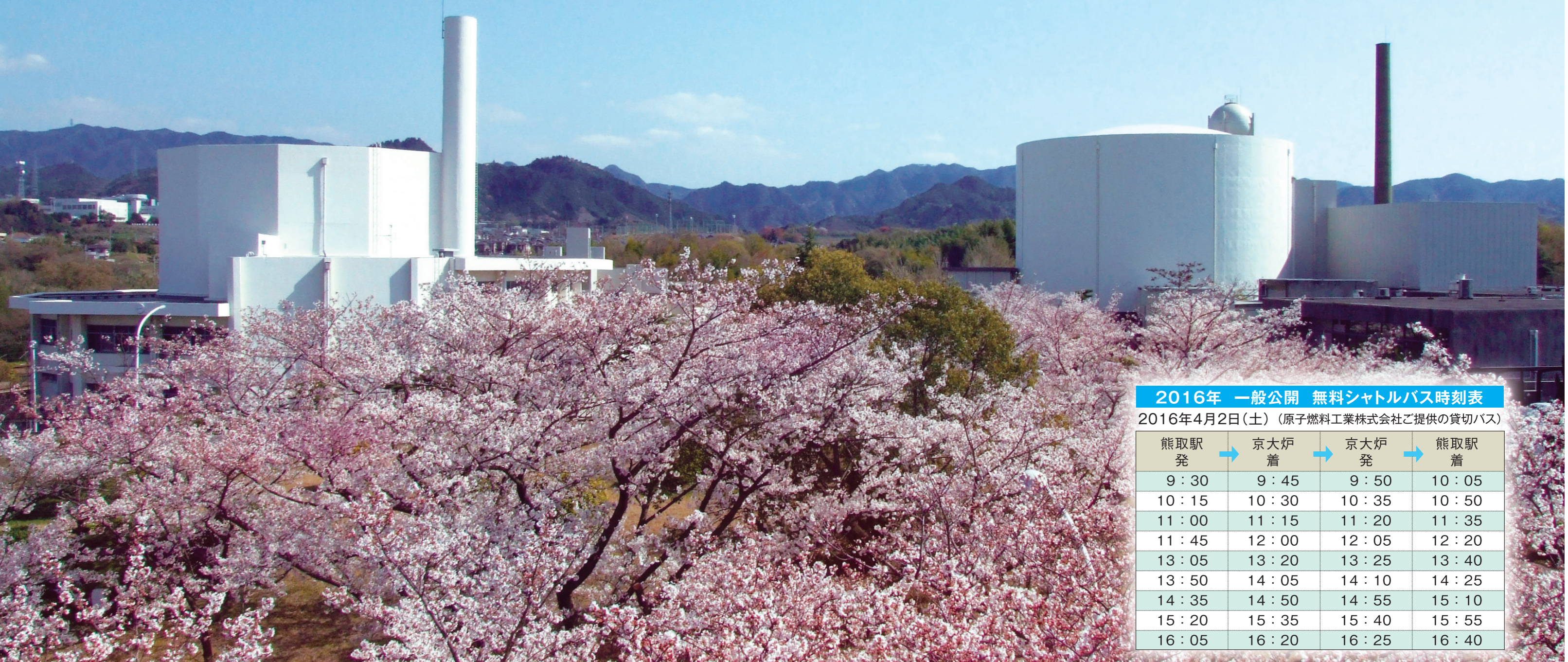
2016年 一般公開 無料シャトルバス時刻表 2016年4月2日(土) (原子燃料工業株式会社ご提供の貸切バス)

ご入場の際は、お一人お一人、運転免許証・パスポート・職員証・学生証などの顔写真付きの身分証明書もしくは健康保険証の提示が必要です。小学生またはそれ以下の年齢の方の入場には、保護者の方の同伴が必要です。ペット同伴での入場はできません。あらかじめご了承ください。