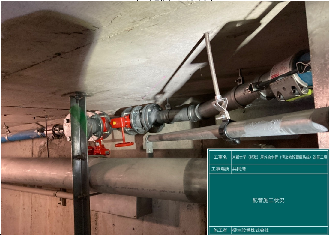
写真説明：消火配管 施工状況 CA棟下共同溝