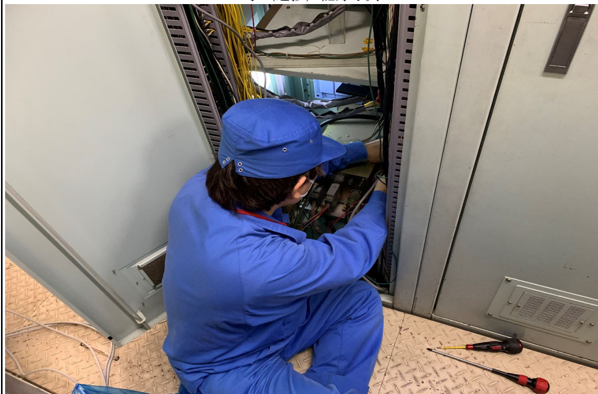
写真説明：原子炉監視設備切替 第一研究棟配線切離し 令和 5 年 4 月 12 日 撮影