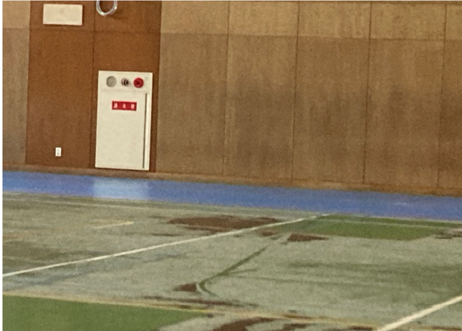
写真説明：体育館 既設消火栓の状況