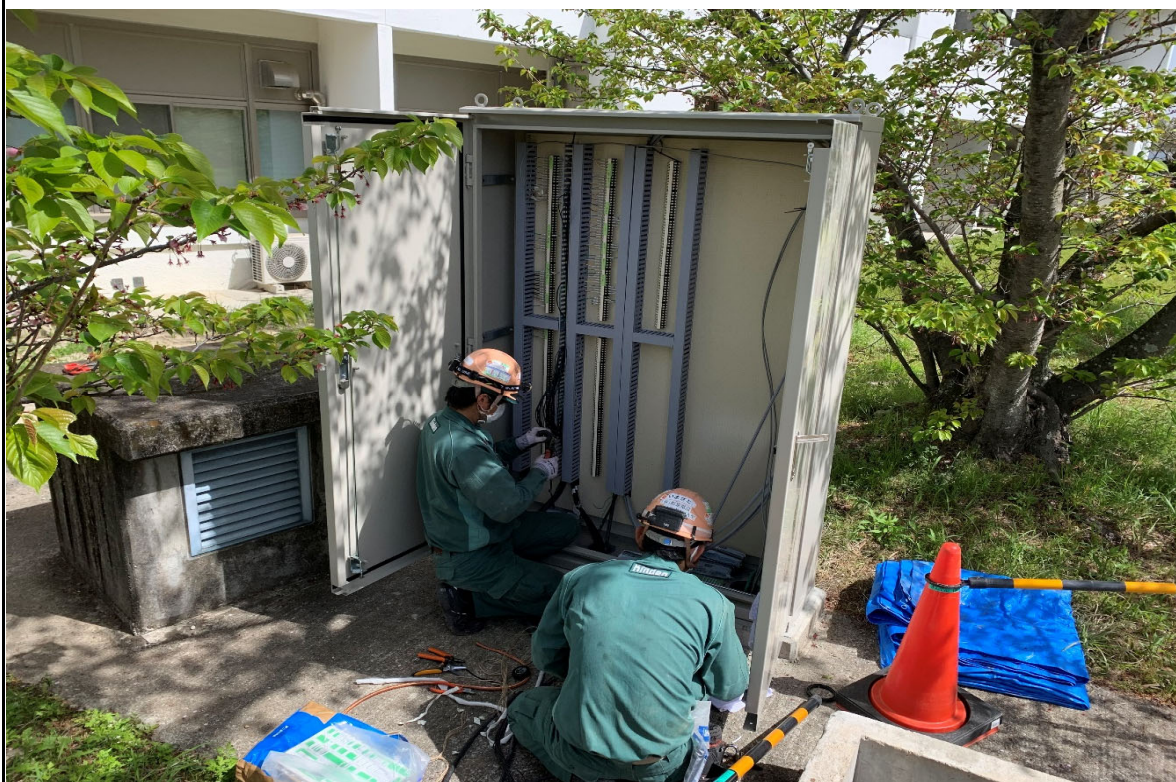
写真説明：原子炉監視設備切替 中継端子盤配線接続 令和 5 年 4 月 12 日 撮影