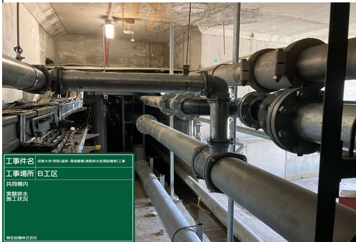
写真説明：共同溝内 実験排水接続 令和 5 年 4 月 22 日 撮影