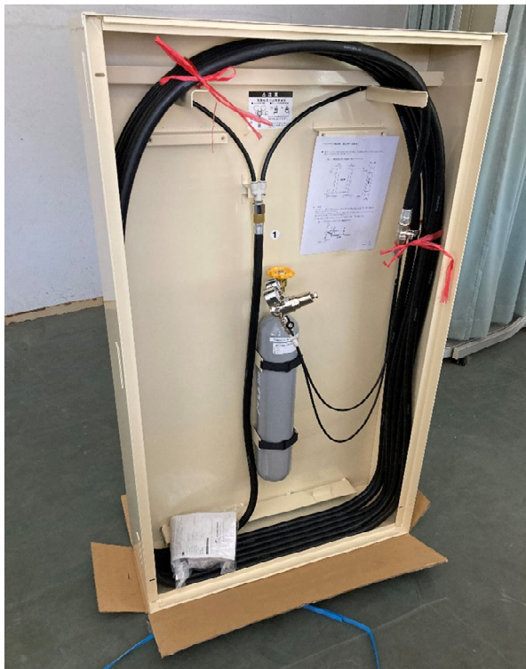
写真説明 体育館 パッケージ消火納入