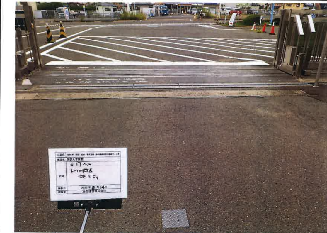
写真説明：正面入口ゲートレール撤去前