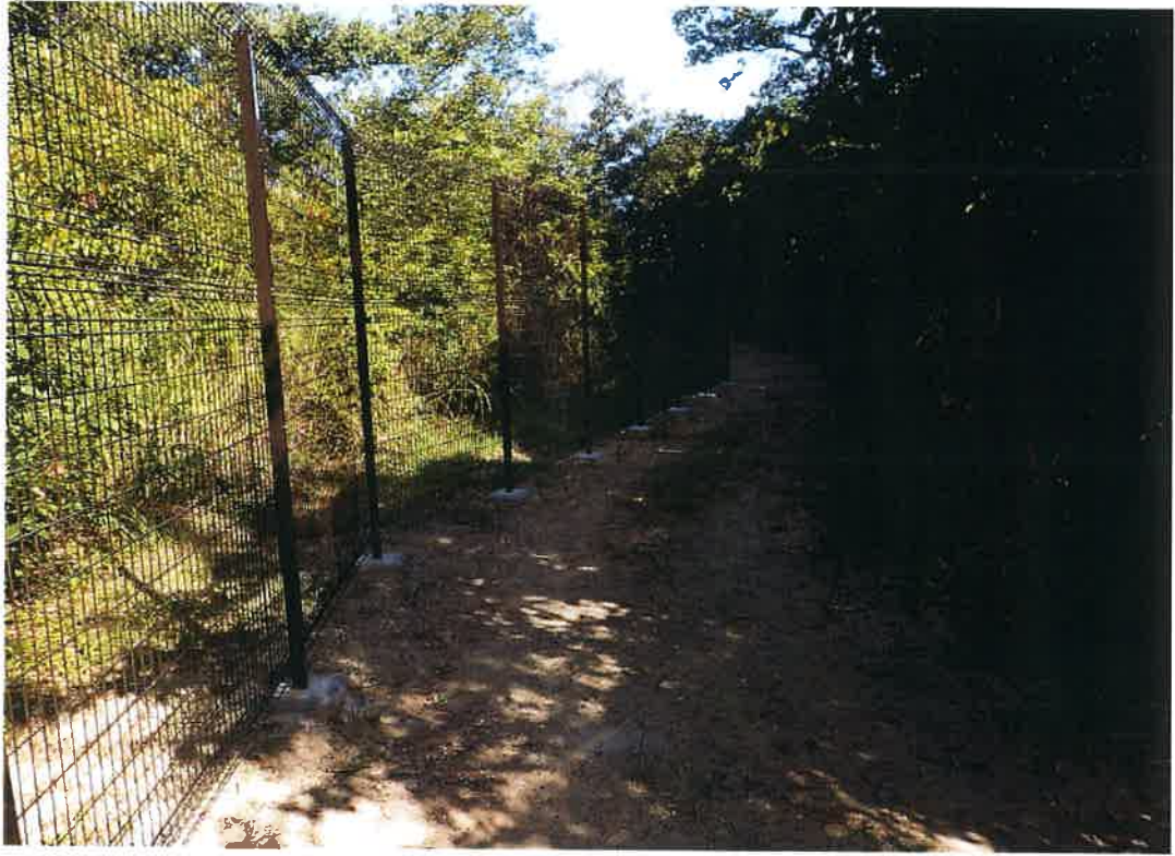
写真説明：⑧工区フェンス完成