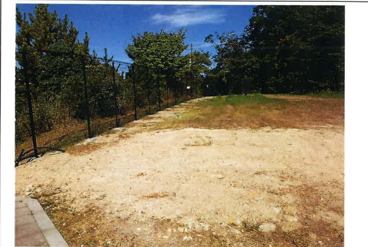
写真説明：⑧工区フェンス完成