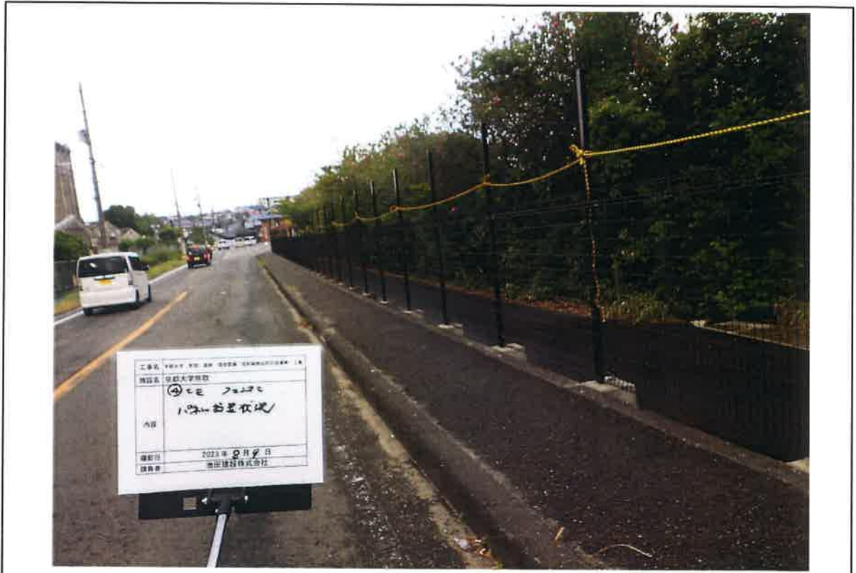
写真説明：④工区フェンス設置状況