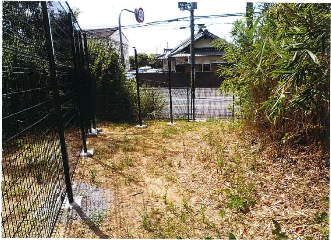
写真説明：⑦工区フェンス完成