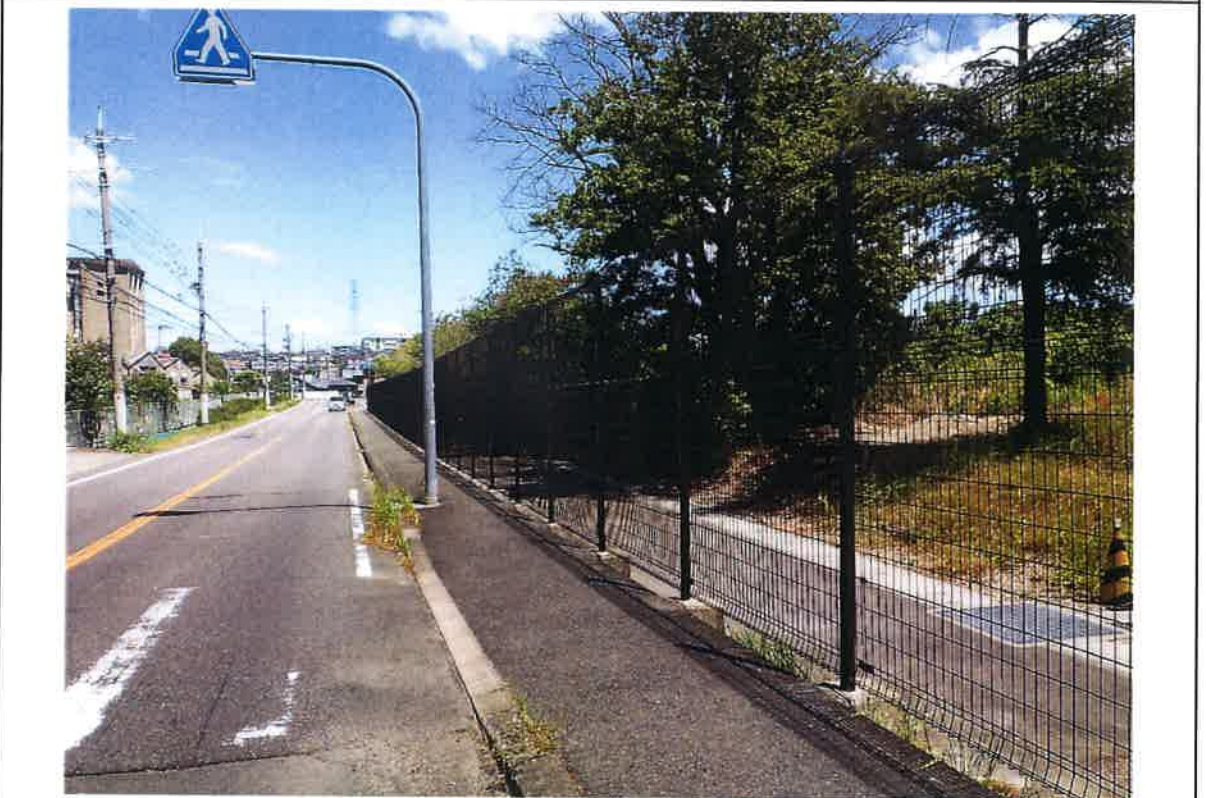
写真説明：④工区フェンス完成