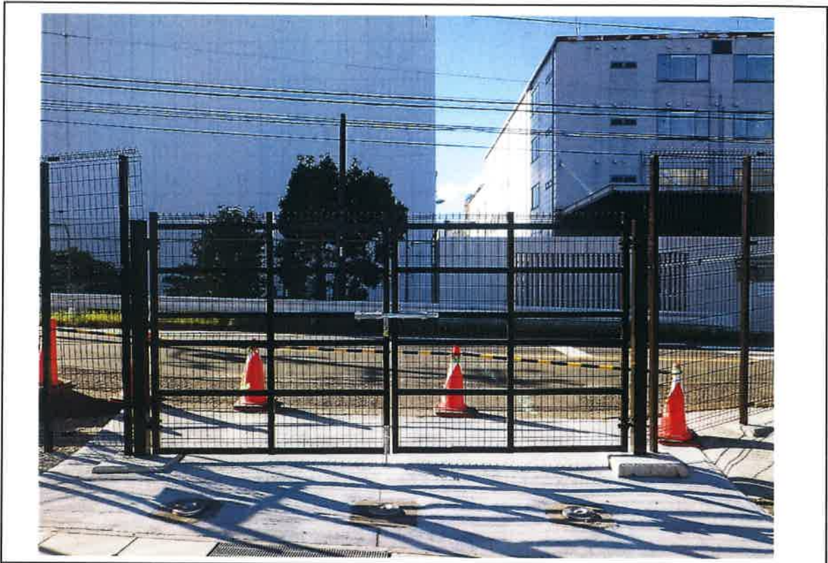
写真説明：㊦メッシュフェンス門扉完成