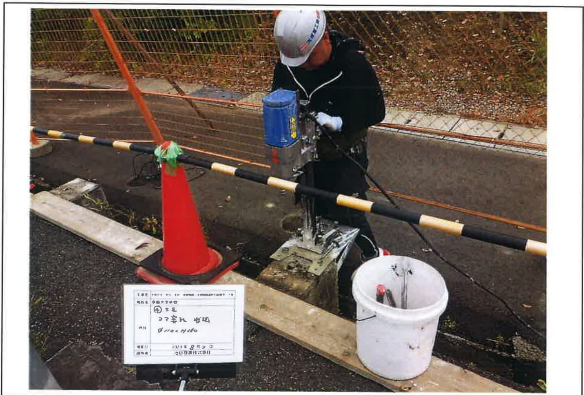
写真説明:④工区 コア穿孔状況