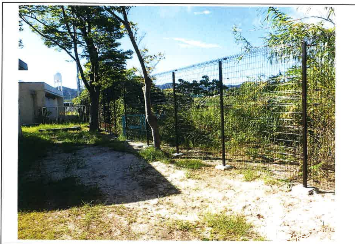
写真説明：⑨工区フェンス完成