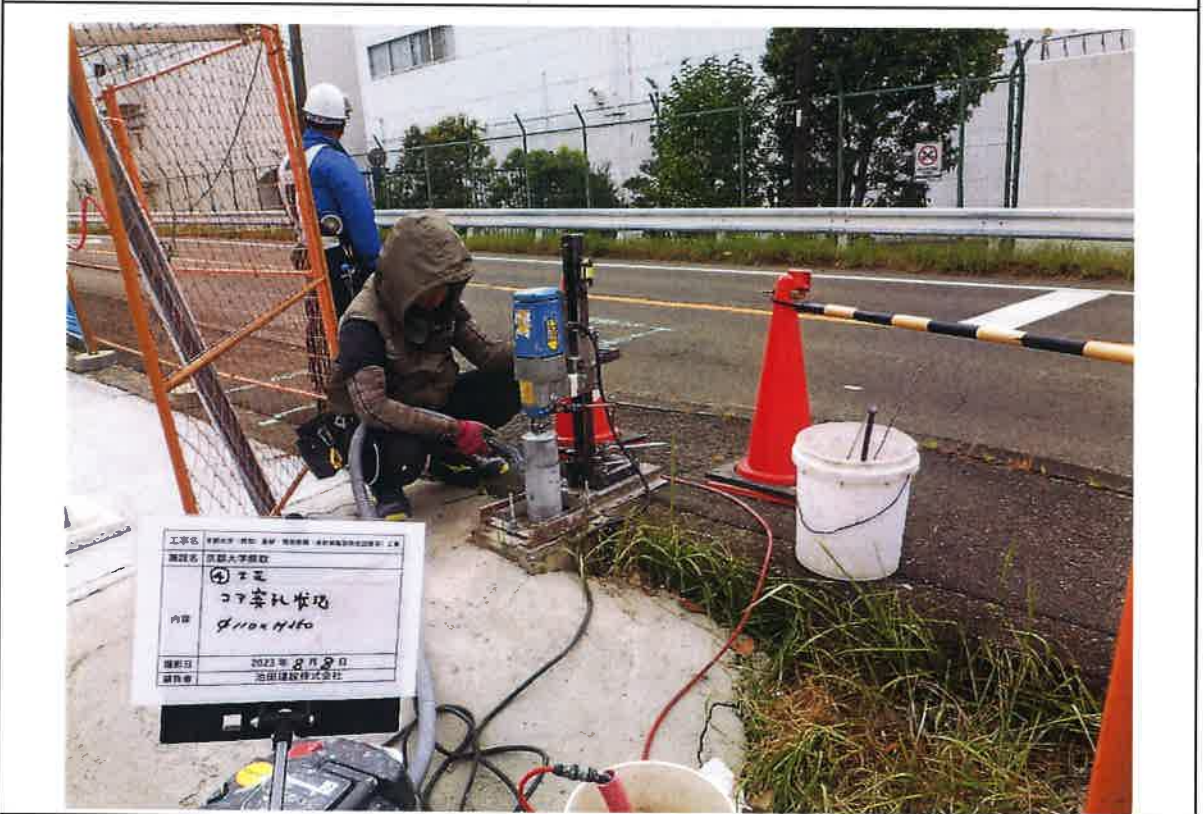
写真説明:④工区 コア穿孔状況